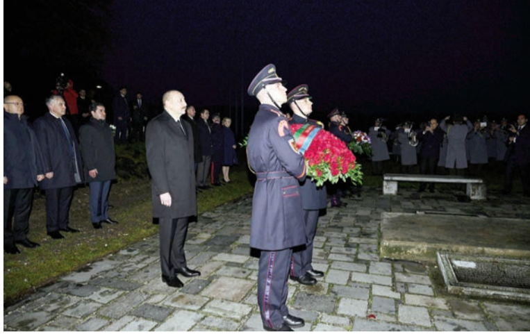
(Əvvəli 2-ci səhifədə)